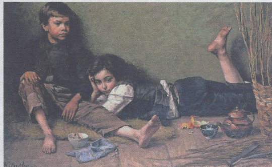
Wally Moes schilderde twee jonge mandenvlechters tijdens hun schafttijd. De luxe sinaasappel voegde ze vooral voor de kleur toe aan de compositie.

'Schildersmooi', noemde de boerenbevolking dat in Laren en omgeving, waar veel Haagse Scholers ook werkten. Wie model wilde staan, moest zich juist niet op zijn zondags kleden,