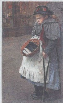
Het lucifermeisje van Floris Arntzenius uit 1890.