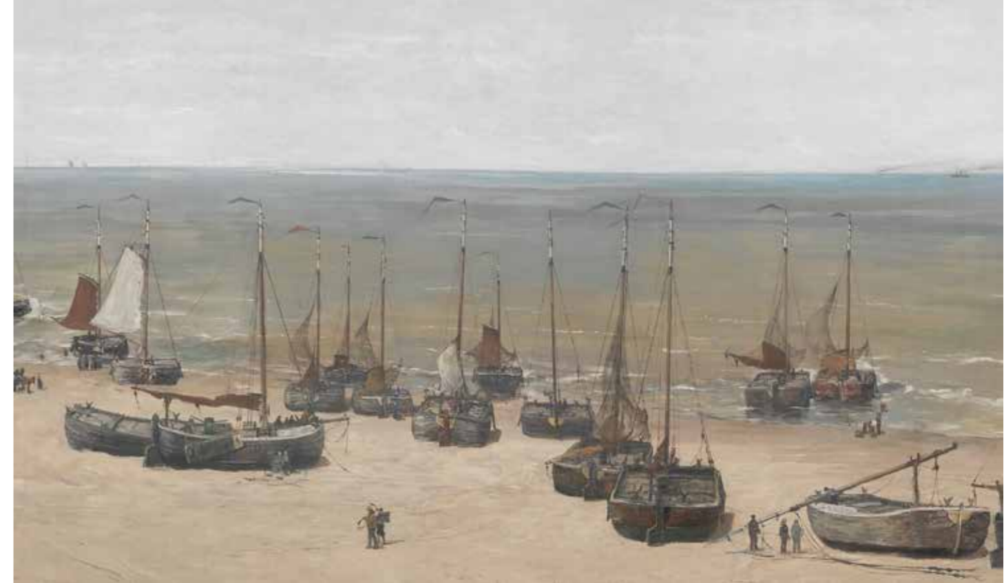
Bomschuiten op het strand (detail), 1881