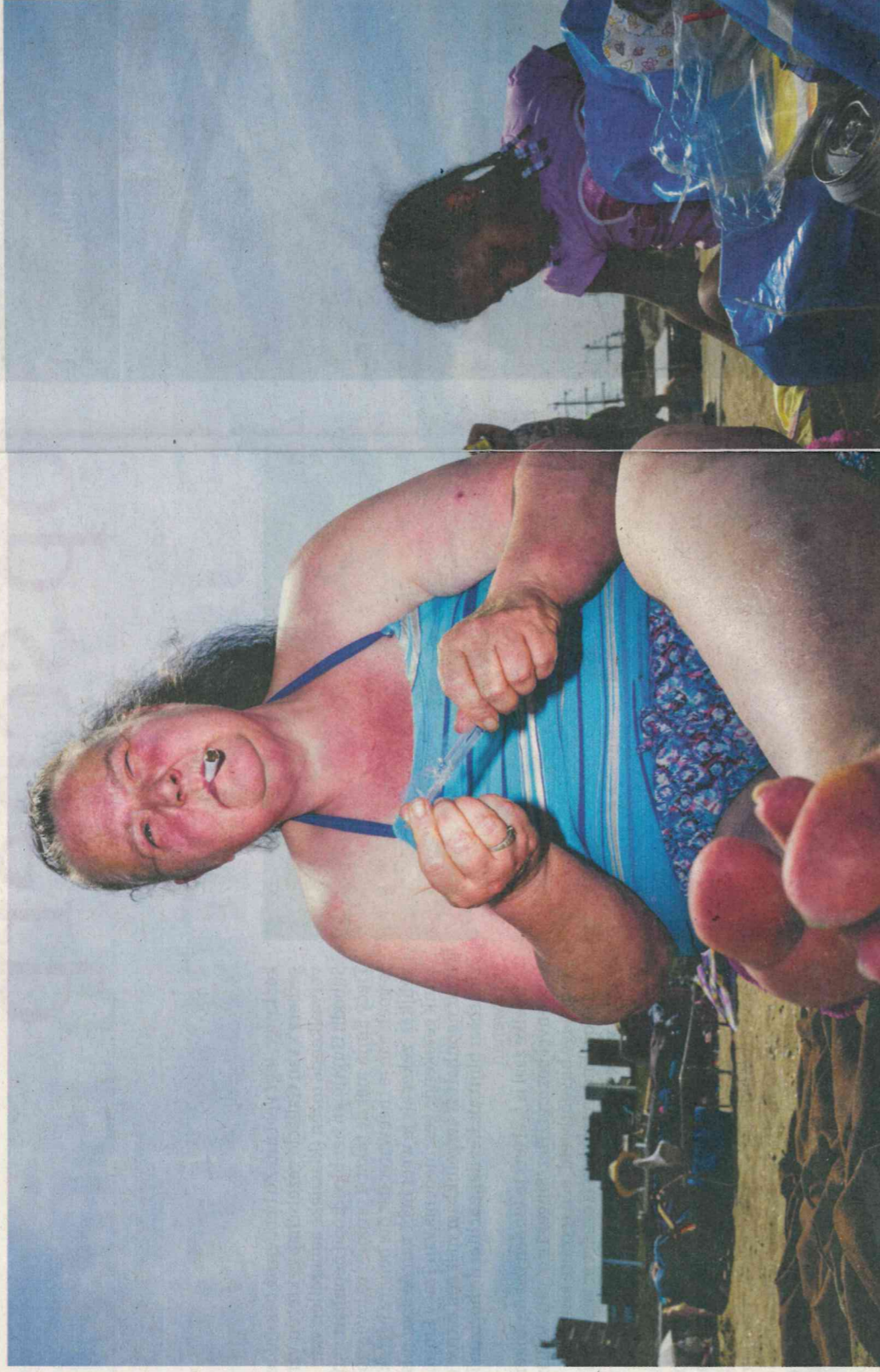
Juni 2019.