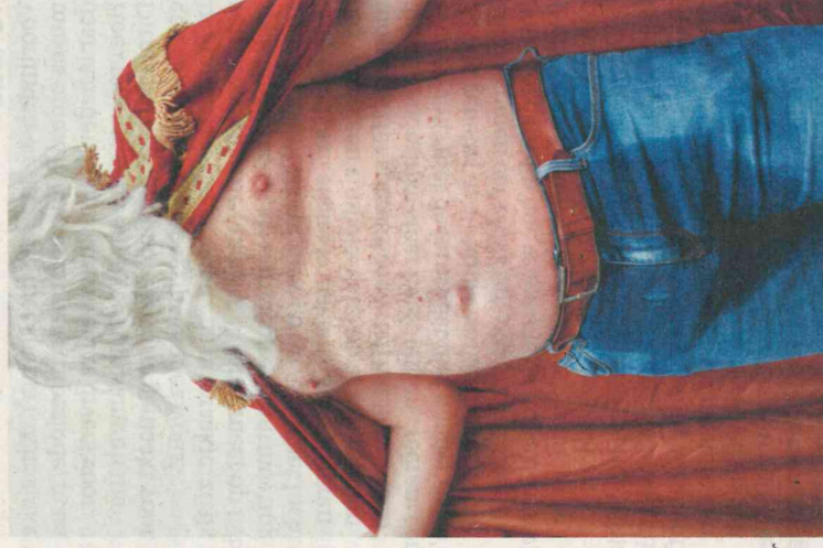
Januari 2020. | Foto: Mirjam Rosa

sen. Pas na beter kijken zie je wat er gebeurt. Een dame telefoneert, een chique leren tas op schoot, een schoen is uitgegleden. Haar hond gaapt en lijkt daardoor haar voet op te slokken. Als tegenstelling